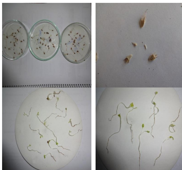
شکل ۲- جوانه‌زنی بذر، رشد ساقچه و ریشه‌چه در بذرهای تحت تیمار در گیاه چوچاق

شده قرار گرفت. بیشترین درصد جوانه‌زنی به تیمار دمای ۱۵ درجه سانتی‌گراد (۸۸ درصد) اختصاص داشت. تیمار دمایی ۲۰ درجه سانتی‌گراد با مقدار عددی ۷۸ درصد، در رتبه‌ی بعدی قرار گرفت. کمترین میزان درصد جوانه‌زنی نیز به تیمارهای