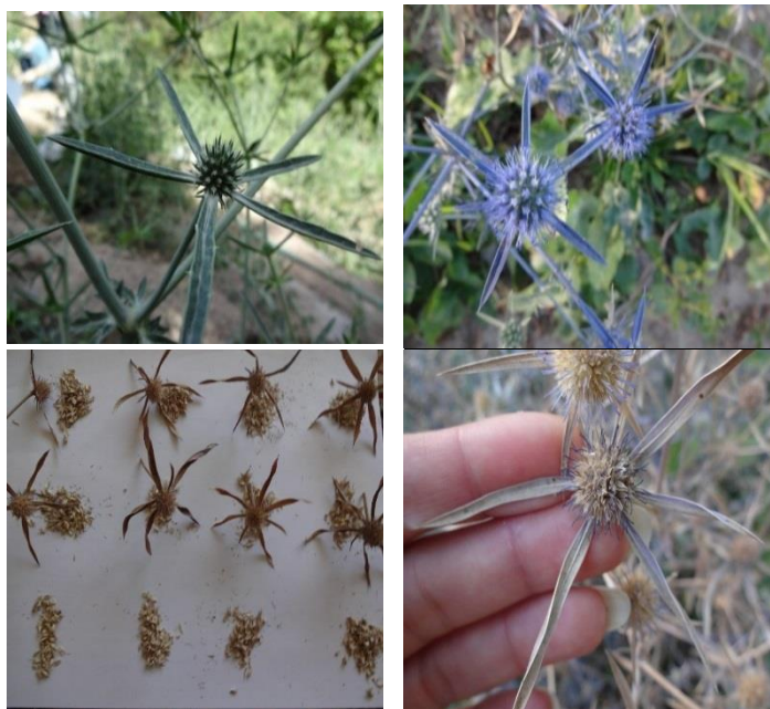
شکل ۱- مراحل مختلف رشد (گلدهی، تکمیل رشد گل‌آذین و تشکیل بذر) گیاه چوچاق