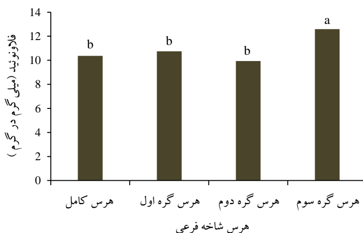
شکل ۱- اثر هرس بر میزان فلاونوئید میوه خیار گلخانه‌ای

* اعداد دارای حروف مشترک در هر ردیف اختلاف معنی‌داری در سطح احتمال پنج درصد بر اساس آزمون دانکن ندارند.