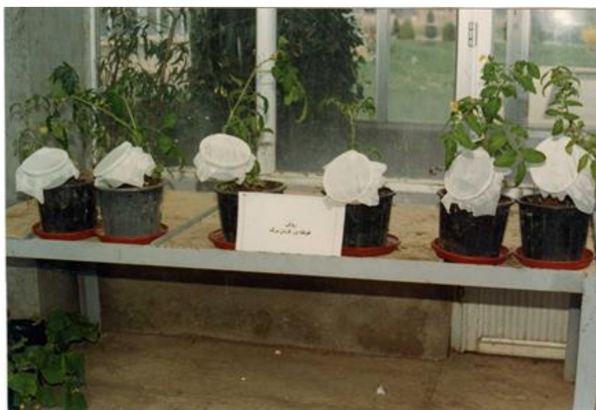
شکل ۱- روش غوطه‌ور کردن برگ‌ها Figure 1- Method of dipping leaves

بررسی اثر حشره‌کشی دو ترکیب روی حشره بالغ جهت آزمایش، برگ‌های گوجه‌فرنگی را بدون جدا شدن از گیاه، به مدت پنج ثانیه در غلظت‌های اسپیروتترامات شامل ۱، ۲/۲، ۵/۰۶، ۱۲/۱ و ۳۰/۲۴ پی‌پی‌ام و سیتووت شامل ۴۰۰، ۱۰۰۰، ۲۱۰۰، ۴۸۳۰ و ۹۶۶۰ پی‌پی‌ام غوطه‌ور کرده و بعد از خشک شدن داخل ظروف یک‌بار مصرف که در کناره آن شیاری برای قرار گرفتن دم‌برگ